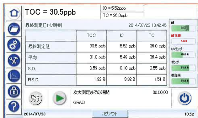
グラフ測定モード表示画面例

より大きくなり、解像度を増したディスプレイには多彩な情報が表示されます。表示されるアイコンをグラフィック表示に変更し、直観的な操作が行えます。測定結果の他、消耗品の消耗度合いやエラー/警告のメッセージが表示され、一目で分析計の状態を確認することができます。