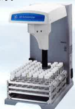
オートサンプラー