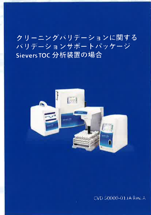
クリーニングバリデーションに関する バリデーションサポートパッケージ Sievers TOC 分析装置の場合