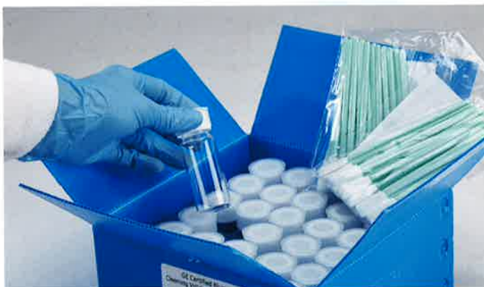
洗浄保証バイアル & スワブセット

また、洗浄保証済みのスワブ(50ppb未満)とバイアル(10ppb未満)などをご提供しております。