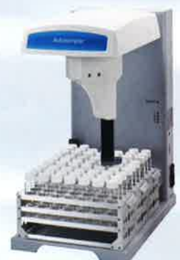
オートサンプラー