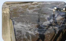
曝気槽： FDO®700 IQ 校正不要の光学DOセンサー