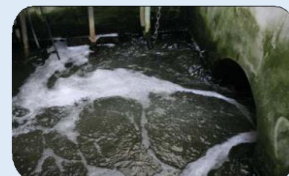
排出口： VisoTurb®700 IQ 超音波洗浄機能付き濁度センサー