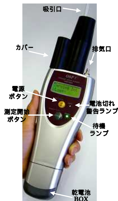
写真1 ハンディ VOC センサー

当社では、VOC 類を ppm レベルで検出できるハンディ VOC センサー ( 写真 1 ) を商品化し、別報にて「干渉増幅反射法式ハンディ VOC センサー」を紹介した。本技術は、VOC 濃度に比例して吸収・放出する高分子薄膜素子と光センシング技術に基づいており、塩素系・石油系 VOC 成分の総量を検出できるもので、その基本特性や GC 法との良い相関性を報告した。その操作の簡易性・迅速性から、VOC 排出濃度の自己管理、土壌・地下水汚染現場での一次スクリーニング調査、各種洗浄・浄化工程の濃度管理等の用途で利用されていることも紹介した。本稿では、VOC センサーの応用例として、ヘッドスペース法と併用した、水中 ( 又は海水 ) に溶存混入した石油分・VOC 類の簡易測定法の概要とそのアプリケーション事例に関して紹介する。