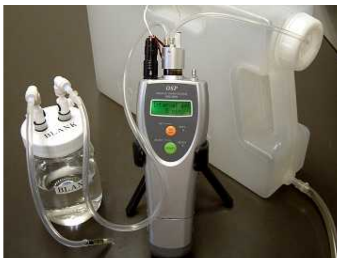
写真 3 バルブヘッドによる水中 VOC のインターバル測定

実際に使用する場合は、写真 3 のように予め準備したゼロ水ボトルでゼロ校正を行い、サンプル水は別途サンプリングポンプや水中ポンプ等で取水タンク内に取り込み、そのヘッドスペースをインターバル測定するという簡便なシステムを構成するだけでよい。必要に応じて取水タンク内をバブリングする、サンプル水を加温する等の前処理