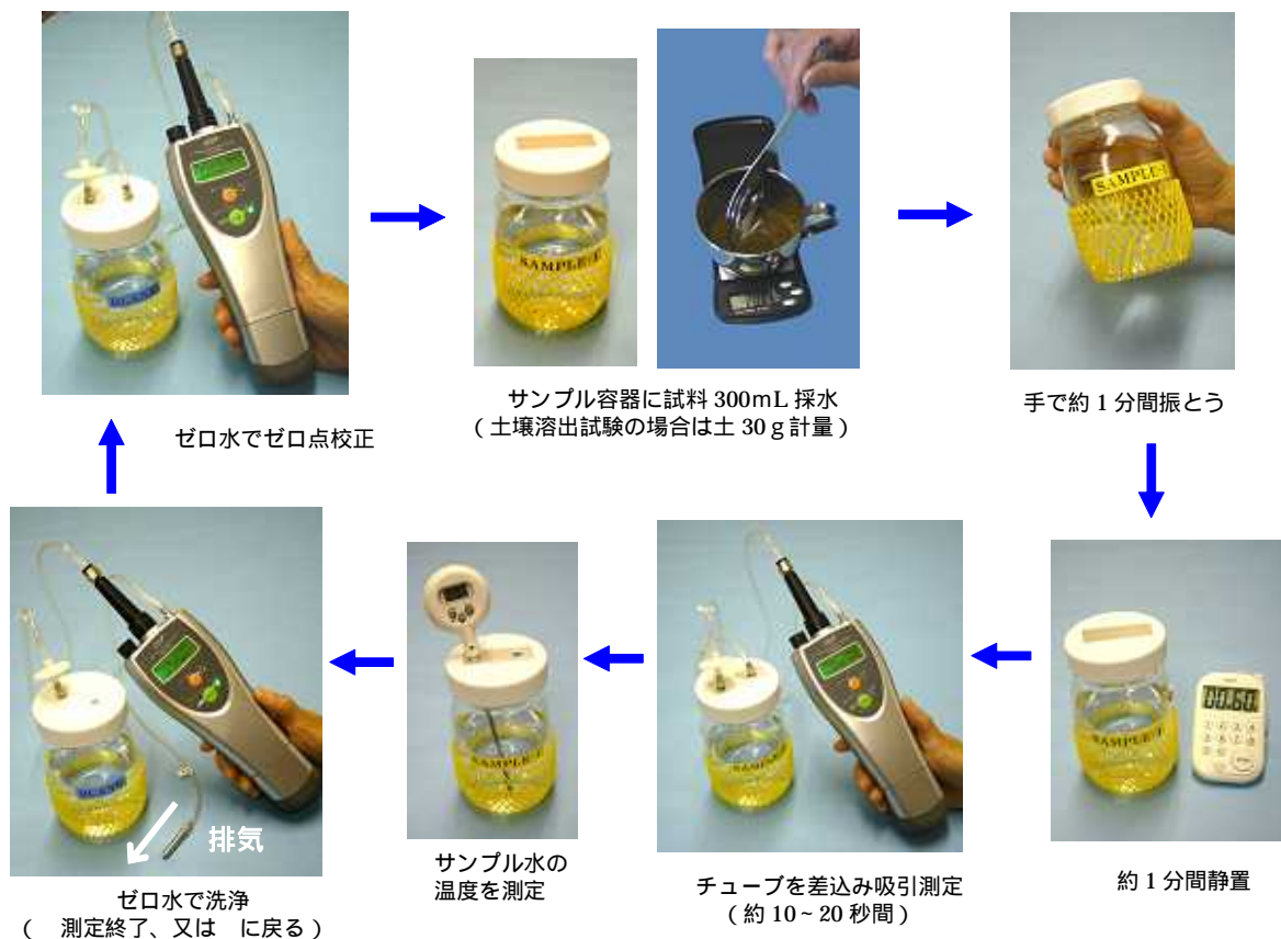
写真 2 水中 VOC 類のヘッドスペース測定手順