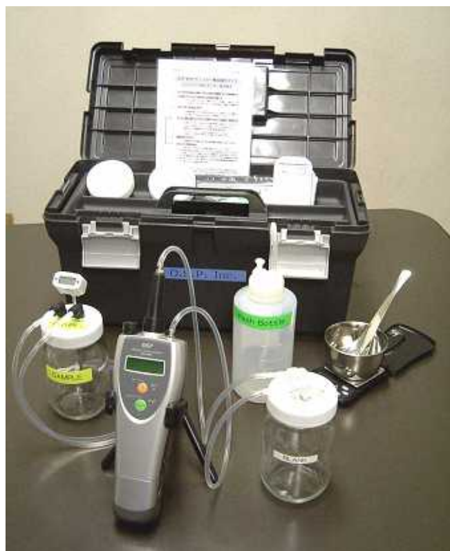
写真4 土壌/水中 VOC 測定キット

技術資料と応用例に関しては当社のホームページ（ http://www.osp-inc.co.jp ）でも詳しく紹介しているので参考されたい。