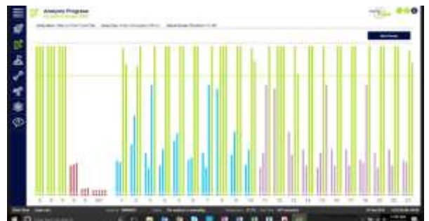
アッセイの進捗状況が分かりやすいエコグラフ