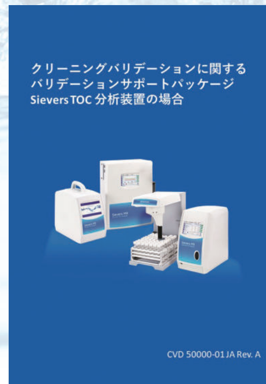
クリーニングバリデーションに関するバリデーションサポートパッケージ Sievers TOC 分析装置の場合