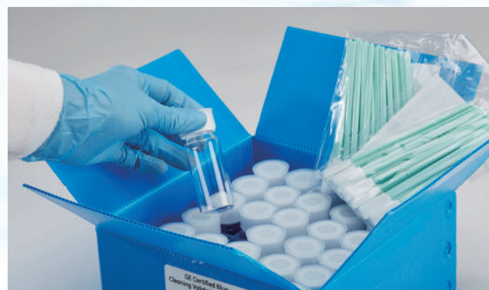
洗浄保証バイアル & スワブセット

また、洗浄保証済みのスワブ(50ppb未満)とバイアル(10ppb未満)などをご提供しております。