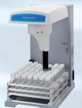
オートサンプラー