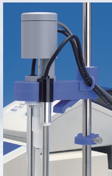
〈電極ホルダは片手でスライドできるワンタッチ方式〉