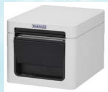
プリンター CT-S255RSJ-WH 【標準セット品】 ★プリンターの機種は変更になる場合があります。