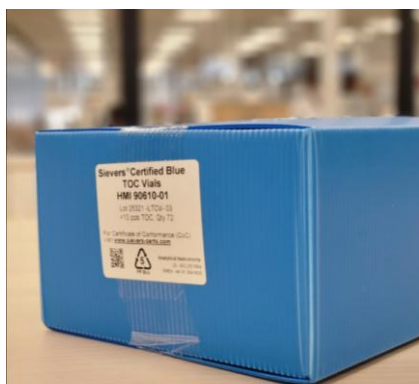
段ボール粉対策 プラダンケース 医薬品製造エリア配慮