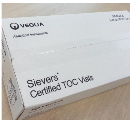
洗浄保証付のため容器由来の コンタミの心配が不要