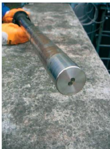
測定開始数週間後の ViSolid センサー