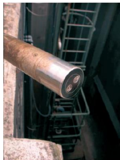
測定開始数週間後の VisoTurb センサー