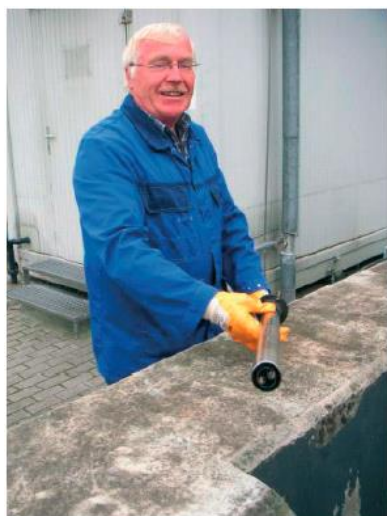
センサーをチェックする BASF 社のスタッフ

試験結果: 事実、超音波洗浄装置を持つこのセンサーは、この難しいアプリケーションに対してワイパー方式の物より明らかに適していることが示された。ほとんど毎日の清掃を必要としていたワイパー方式のセンサーとの直接比較において、VisoTurb センサー(DINによる濁度測定)は4週間以上も正確に、また問題なく測定を行うことができた。4週間以上たてば、このセンサーにおいてさえも手による洗浄が必要であった。この特別の使用例において、ViSolid TSS センサー(DINに規定されているよりも急角度で濁度を測定)は、6週間以上、手洗浄なしで安定して測定を行うことができた。