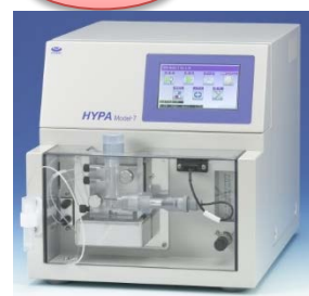
過酸化水素計 HYP A M-7