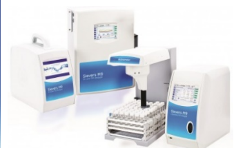
Sievers TOC 計 M9