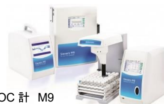
Sievers TOC 計 M9

技術資料のご提供も可能ですので、ぜひ別紙1のアポイントメントシートからお申し付けください。また、当日のご来場が難しい場合も別紙2からご相談ください。