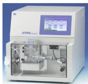
過酸化水素計 HYPA M-7

過酸化水素計 HYPA M-7、TOC 計 M9、呼吸活性測定器 OxiTop を展示いたします。OxiTop シリーズは、ムーンショット型研究開発事業の「海洋分解性プラスチックの研究開発」において生分解性試験ツールとして使用されています。