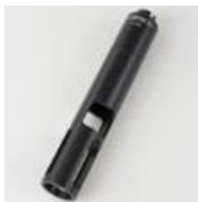
電極保護筒 A 925-P/K