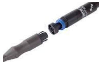
ケーブルはワンタッチ装着 タイプDOセンサー: FDO925-P型