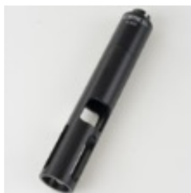
電極保護筒 A 925-P/K