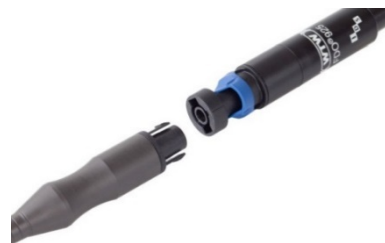
ケーブルはワンタッチ装着 タイプDOセンサー: FDO925-P型