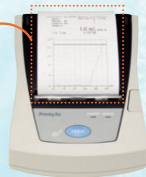
プリンター Printy2 (SD1-31SJ型) 【標準セット品】