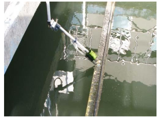
- 汚泥掻き寄せ機対策のデフレクターキット