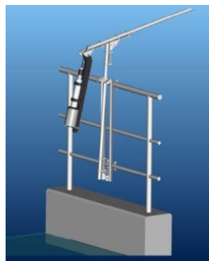
- アームを畳んだ状態